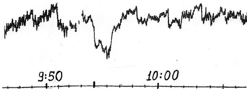
рис. 3. 08.06.2004. Заход Нептуна в 9:56.